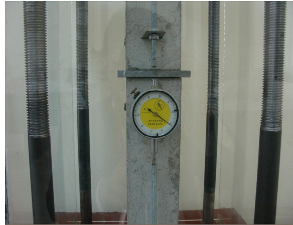
Hình 2. Đồng hồ đo biến dạng có độ chính xác 0,002 mm