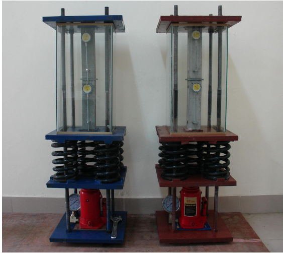
Hình 1. Thí nghiệm biến dạng từ biến

do”, không có tải tác dụng. Cường độ biến dạng được đo bằng đồng hồ đo biến dạng loại quay số cho phép tính chính xác tới 0,002 mm.